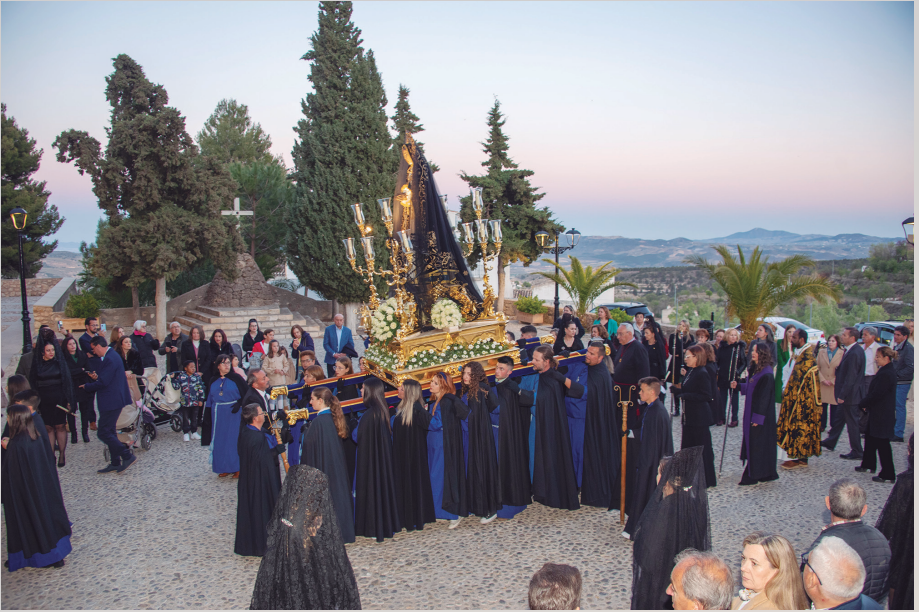
La Virgen de los Dolores llegando al atrio del convento de San Luis. Procesión del Santo Entierro, Semana Santa 2023