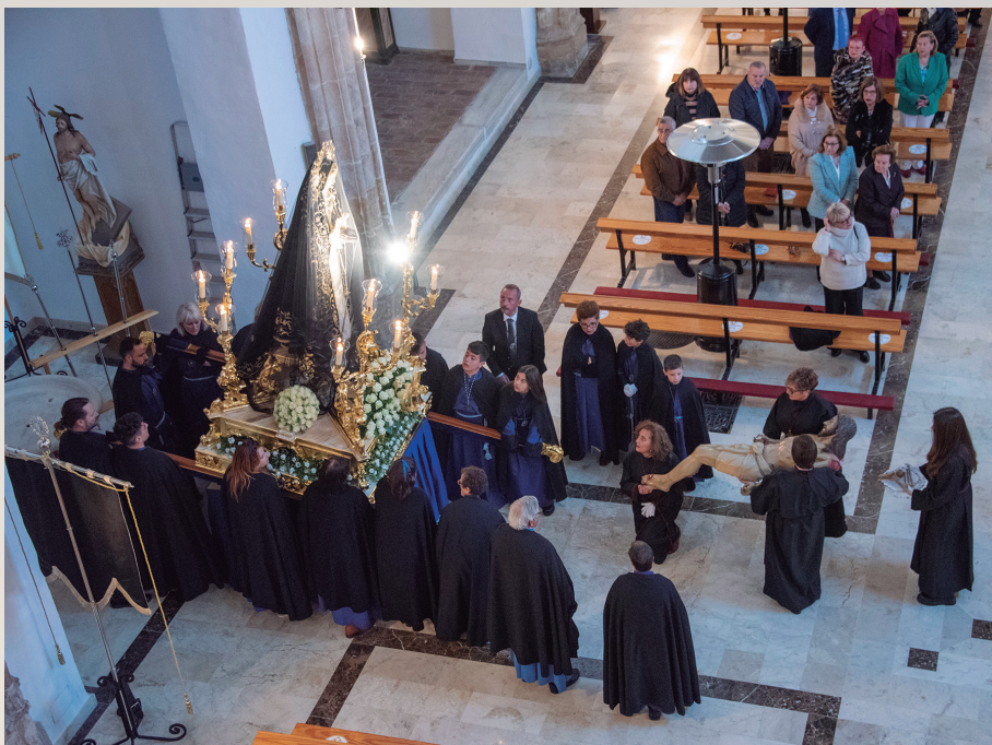
Presentación del Señor a la Virgen de los Dolores tras de su bajada de la Cruz. Celebración de los Oficios de la Pasión del Señor, Semana Santa 2023