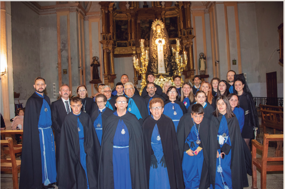
Grupo de hermanas y hermanos que acompañaron a la Virgen de los Dolores en la procesión del Santo Entierro de la Semana Santa 2023